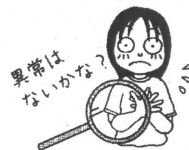
健康診断の項目と対象学年（★が対象学年）

◎ 健康診断は、体がしっかりと発 育しているか、体に病気や異常が ないかを調べます。